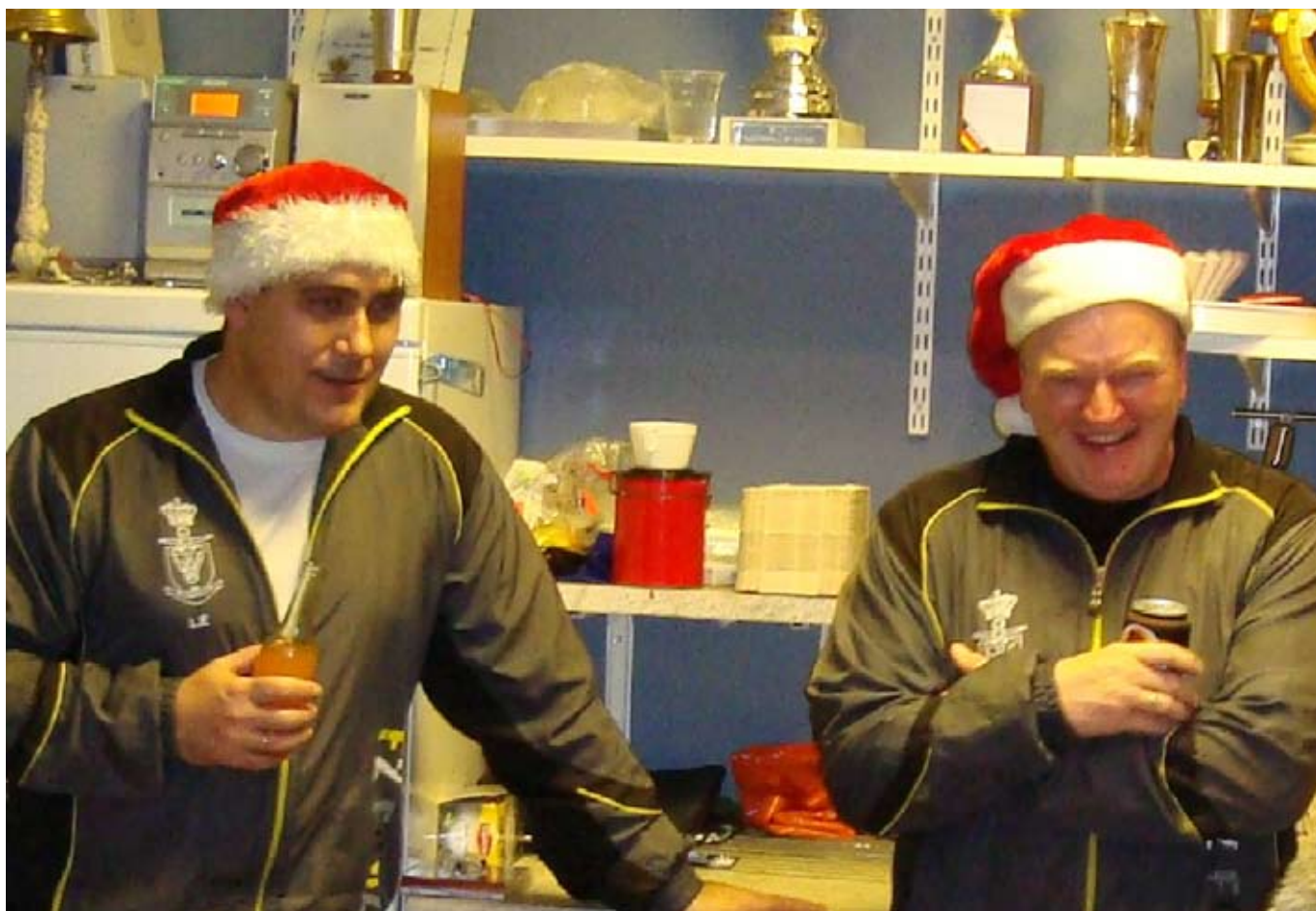
To af "Nisserne"