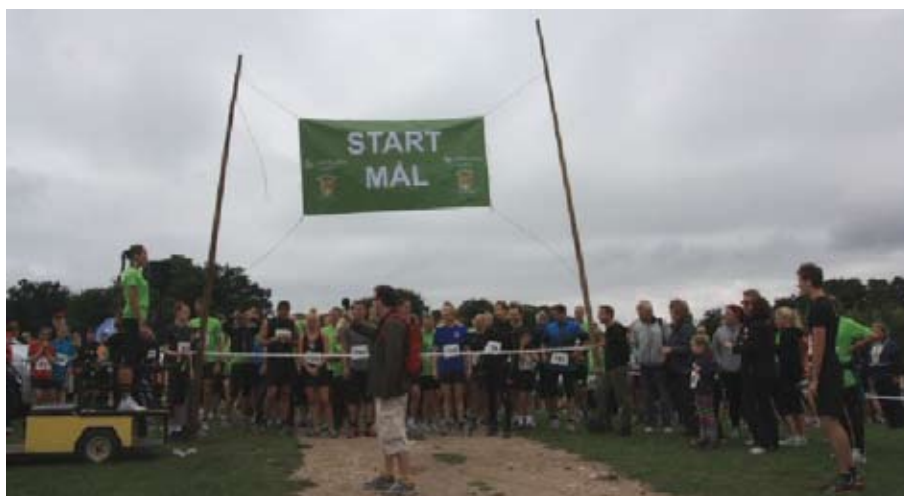
"Gepard" løbet 2012.

Nu venter opløbet forude, og ved Varna løber man over Skindertofte - den modsatte vej af "udrejsen", inden det går ned mod Tangkrogen. Alt i alt et løb, som er et "besøg" værd.