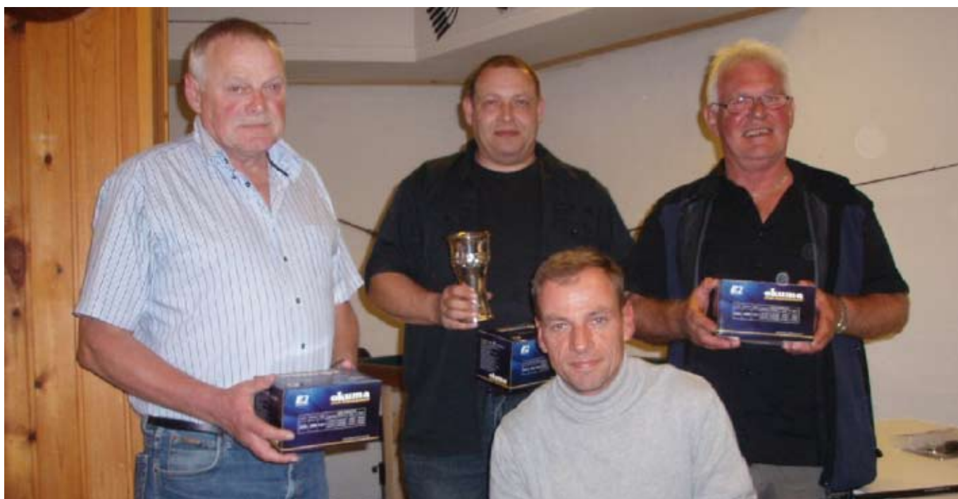
Vinderholdet fra Korsør